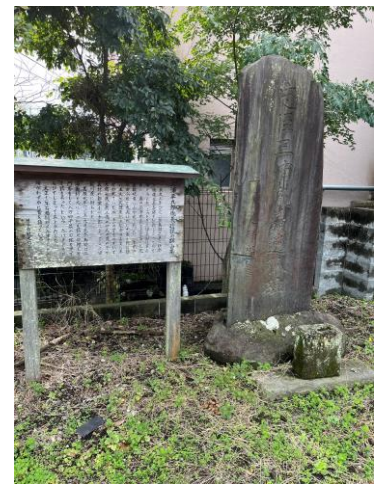
三浦遺孤の碑 (左)昔あった碑 (右)現在の碑