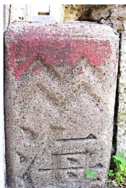
山形二条マーク海