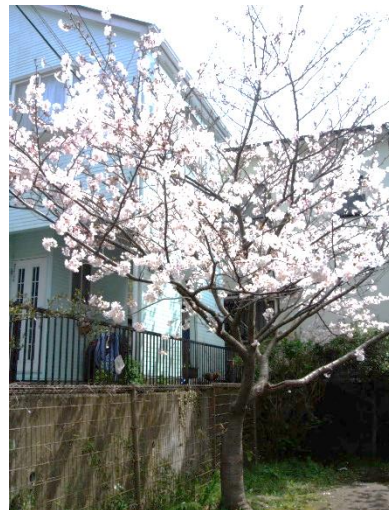
中里児童公園の桜

暖かい時季となりました。田越川の水辺に咲いている草花もきれいですよ。散歩はいかが。