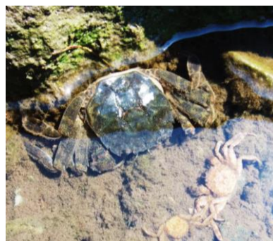
もくず蟹も捕まえました。