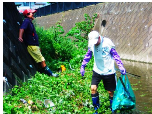
暑いので一休み、ごみがかくれている。