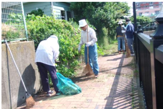
歩道もきれいに掃除。