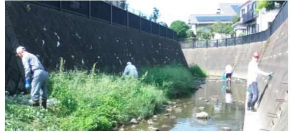
ゴミを拾い草も刈る、忙しいです。