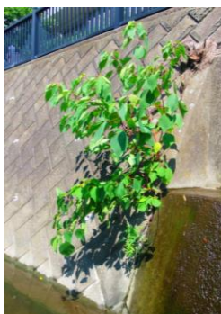
護岸のすきまから雑木が。たくましい。