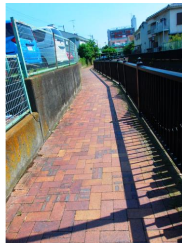
歩道もきれいになりました。